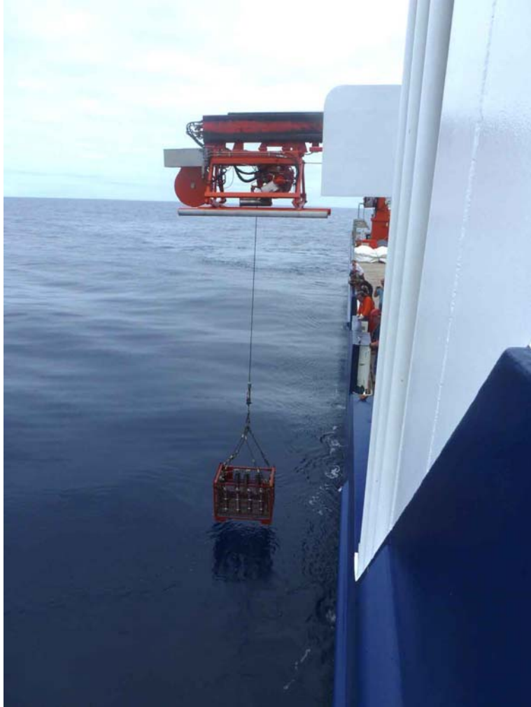
Releaser Test, 19.1.2012.

(OBS) für ein Langzeitexperiment ausgelegt werden. Gravimetrische Daten werden durch ein Schiffsgravimeter aufgezeichnet. Dazu soll die Topologie des Meeresbodens anhand eines Kongsberg EM120 Fächerecholots und die Sedimentdicke durch einen Atlas Hydrographic Parasound erkundet werden. Das Einholen der OBEM und OBS ist für Januar/Februar 2013 geplant.