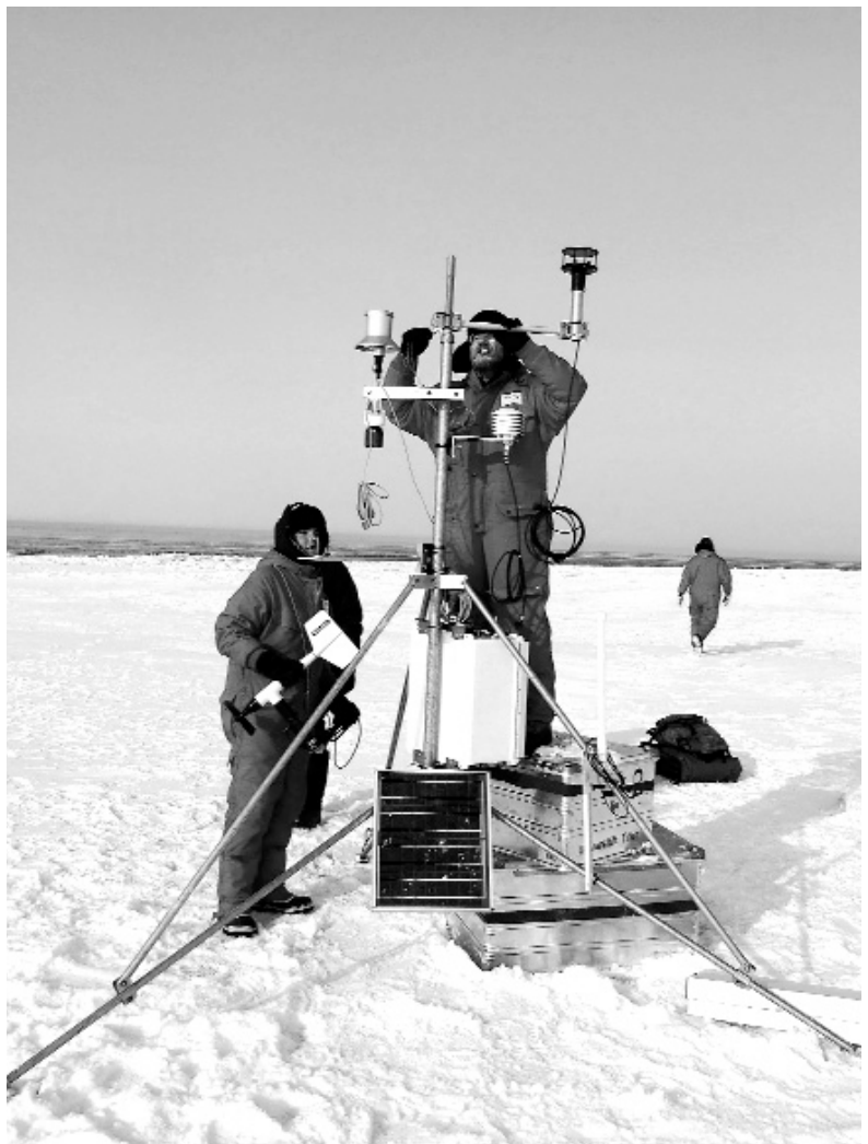
Abb.4: Trierer Umweltmeteorologen im Einsatz: Aufbau einer Wetterstation am Polynja-Rand.