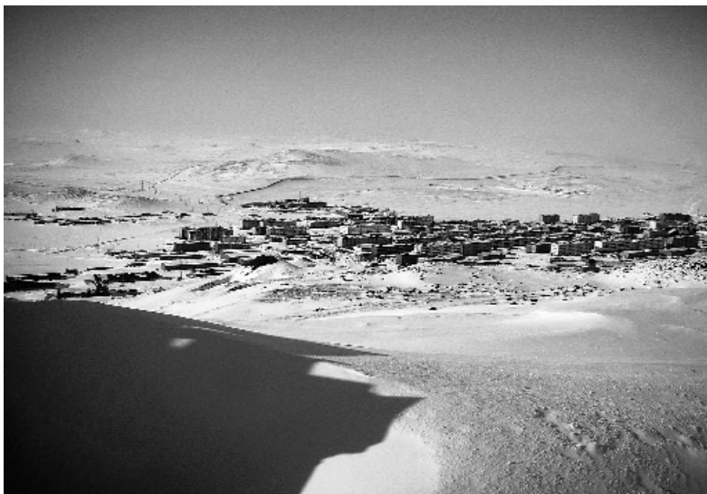
Abb.2: Blick von Süden auf Tiksi.

Wie wirken sich Prozesse der Wechselwirkung zwischen Atmosphäre, Meereis und Ozean entlang der Küstenränder der Laptev-See aus? Was passiert, wenn Meereis durch Wind wegtransportiert wird? Von der Expeditionsbasis in der sibirischen Hafenstadt Tiksi, starteten Wissenschaftler mit dem Hubschrauber in die Eiscamps auf dem Meereis. Vom Festeis am Rand der Polynja wurden zahlreiche meteorologische und ozeanographische Messungen durchgeführt sowie hydrologische und biologische Proben aus verschiedenen Wassertiefen der Laptev-See genommen. Kurzzeit-Meeressbodenobservationen nahmen während der gesamten Dauer der Expedition kontinuierlich ozeanographische Daten auf.