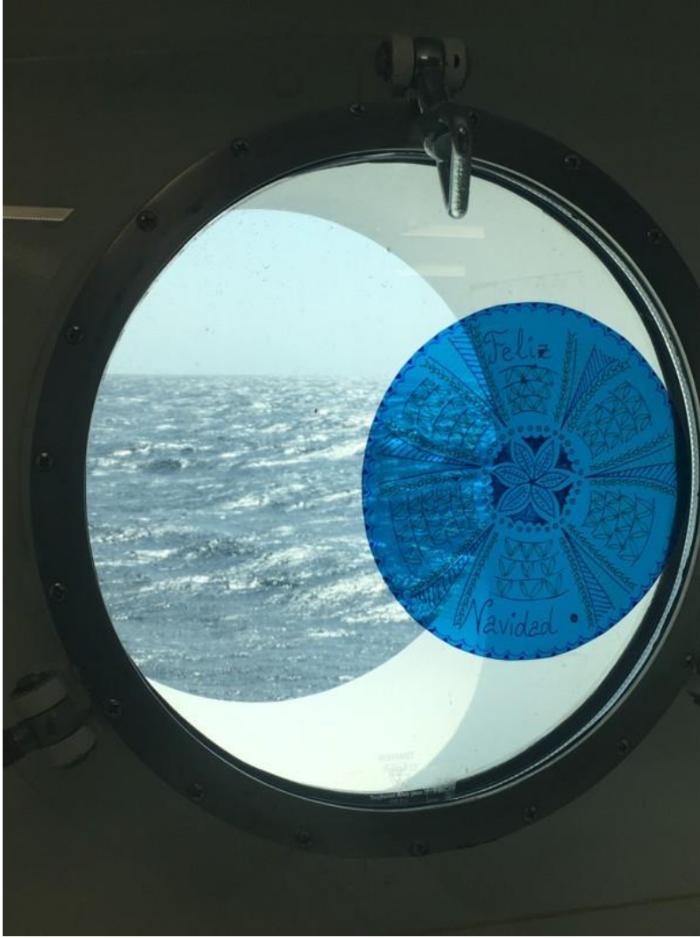
Abb. 3: Feliz Navidad auf See