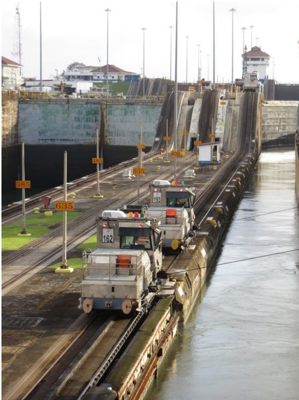
Abb. 1: Einfahrt in die Gatún-Schleuse des Panamakanals, geführt von Mulis.