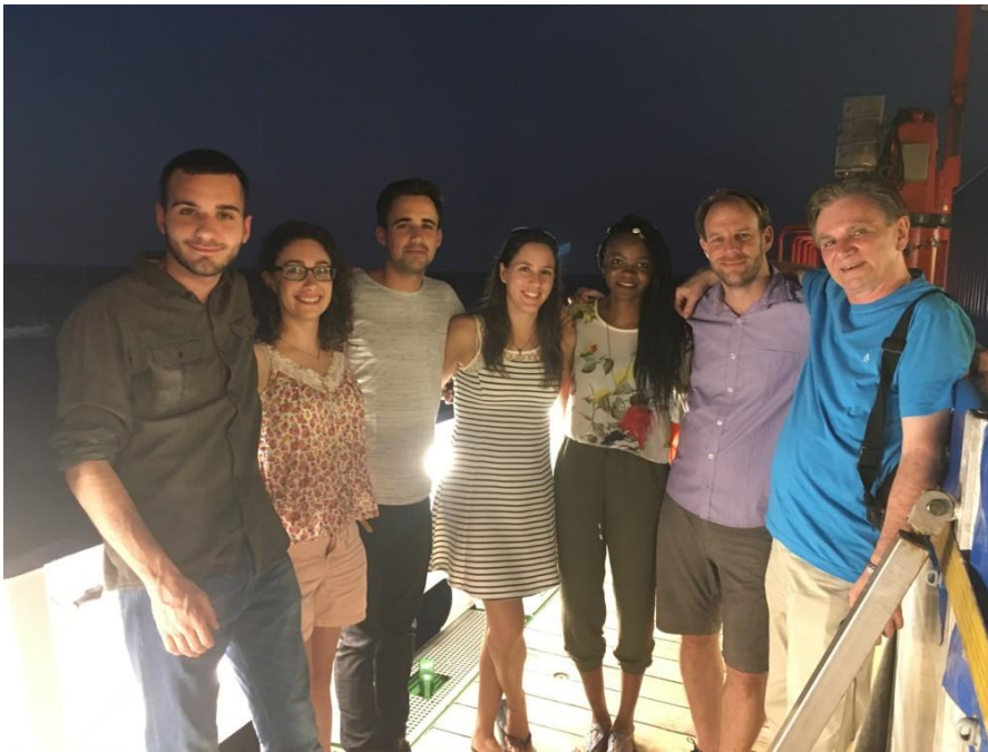
Abb. 4: GEOMAR-Team während MSM80