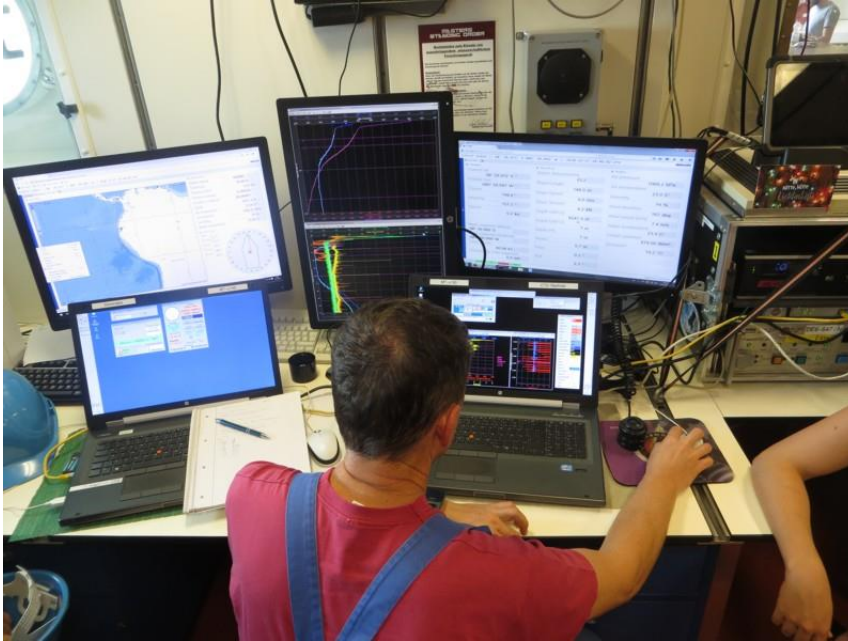
Abb. 2: CTD-Leitstand in der Datenzentrale: die physikalischen Ozeanographen bei der Datenerfassung