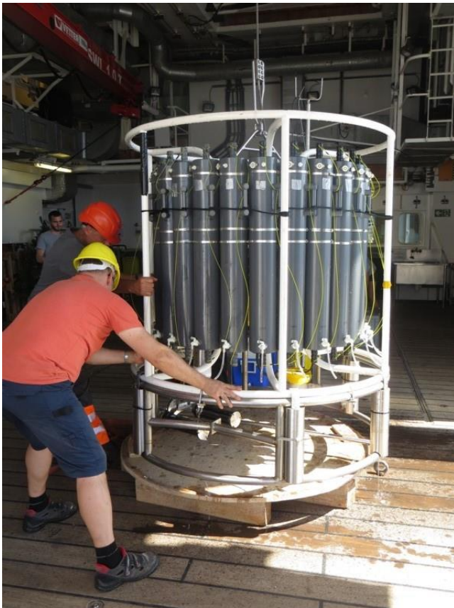
Abb. 1: CTD/Rosette nach dem Einsatz zurück im Hangar

Volker Mohrholz (für das IOW-Team) und Holger Auel