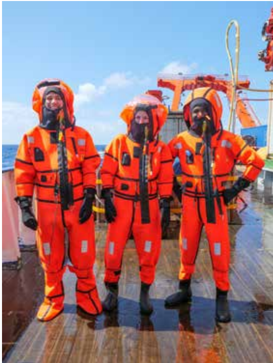
Sicherheitsübung mit Überlebensanzug

Nigeria an Bord. Für diese und andere Mitfahrer gibt es jeden Vormittag eine Vorlesung und abends, im fast täglichen Seminar, werden verschiedenste Aspekte der Ozeanographie diskutiert.