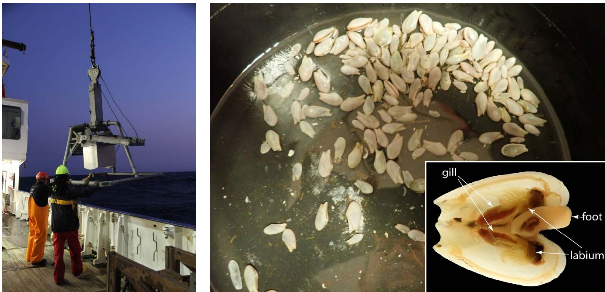
Abb. 1 links: Einsatz des Großkastengreifers ab Wassertiefen von mehr als 500 m; rechtes: etwa 100 lebende Lembulus bicuspidatus konnten aus den Sedimenten gesammelt werden, Inlay: nach Inkubationsexperimenten wurden die Kiemen und das Labium für spätere Untersuchungen in RNAlater fixiert.

Kernarbeiten im nördlichsten Arbeitsgebiet auf dieser Expedition zielten auf Untersuchungen zu möglichen Adaptationsmechanismen der makrozoobenthischen Organismen an die Randbereiche der Sauerstoffminimumzone. Insgesamt wurden 7 Stationen beprobt, wobei die drei westlichsten und tiefsten (500 bis 1500 m) hauptsächlich zur Erfassung der Biodiversität dienen. Die neu gewonnenen Proben werden später im Labor am Mikroskop ausgewertet. Die Arten, deren Abundanz und die Biomasse werden bestimmt. Außerdem wurden bereits an Bord lebende Individuen der Zielart Lembulus bicuspidatus (Bivalvia) gewonnen (Abb. 1) und inkubiert. Dabei wurden zum einen die Respirationsraten gemessen. Zum anderen wurden die Tiere unterschiedlich lange in sauerstofffreiem Wasser gehältert und später seziiert. Dazu wurden sowohl Kiemen als auch das Labium getrennt in RNAlater fixiert (Abb. 1). Im Labor soll später herausgefunden werden, welche Stoffwechselstrategie (aerob bzw. anaerob) verfolgt wurde und welche Enzyme dafür verantwortlich sind. Ferner soll aufgezeigt werden, welche endosymbiontischen Bakterien mit welchen Funktionen dazu beitragen, dass die Art die starken Schwankungen in der Sauerstoffverfügbarkeit ertragen kann. Wie bereits im 4. Wochenbericht vermutet, konnten die Arbeiten entlang der Grenze zwischen den angolanischen und namibianischen Hoheitsgewässern am Abend des 1. September mit vielen neuen Erkenntnissen und Proben abgeschlossen werden.