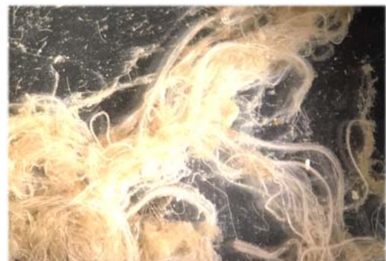
Abb. 3 Ein Knäuel von Thioploca Hüllen aus den Sedimentsiebenen der Benthologen.

Auch auf dem 25°S Schnitt wurden wie schon vorher auf 23°S bedeutende Populationen der "namibischen Schwefelperle" Thiomargarita namibiensis im Sediment gefunden und näher untersucht. Diese Riesenbakterien sind typisch für die Sulfid-reichen Schlämme vor der namibischen Küste. Dank der Benthologen und ihrer Siebe wissen wir jetzt jedoch, dass es im Norden unseres Untersuchungsgebietes offenbar noch eine weitere Population von großen Schwefelbakterien gibt, die ansonsten die Sedimente der Auftriebsgebiete entlang der südamerikanischen Westküste in großen Mengen bewohnt. Diese fädigen Bakterien