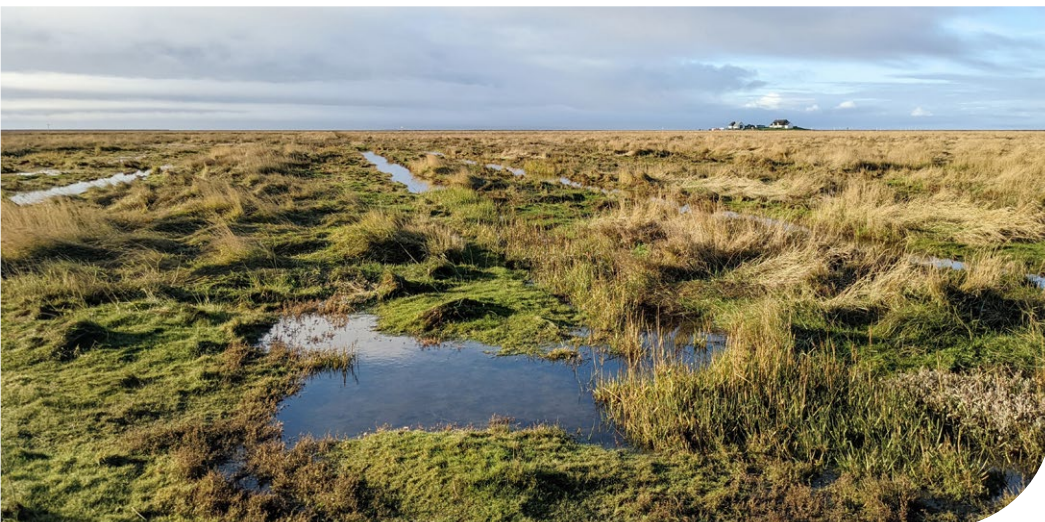
Salzmarschen, Hamburger Hallig.

Basierend auf der in CDRmare durchgeführten Grundlagenforschung wollen die Expert:innen innovative Verfahren zur Flächenausdehnung der vegetationsreichen Küstenökosysteme sowie politische Handlungsempfehlungen entwickeln, mit denen sich die Kohlendioxid-Aufnahme der Meereswiesen und -wälder auf umweltverträgliche und gesellschaftlich akzeptierte Weise steigern ließe – an deutschen Küsten ebenso wie weltweit.