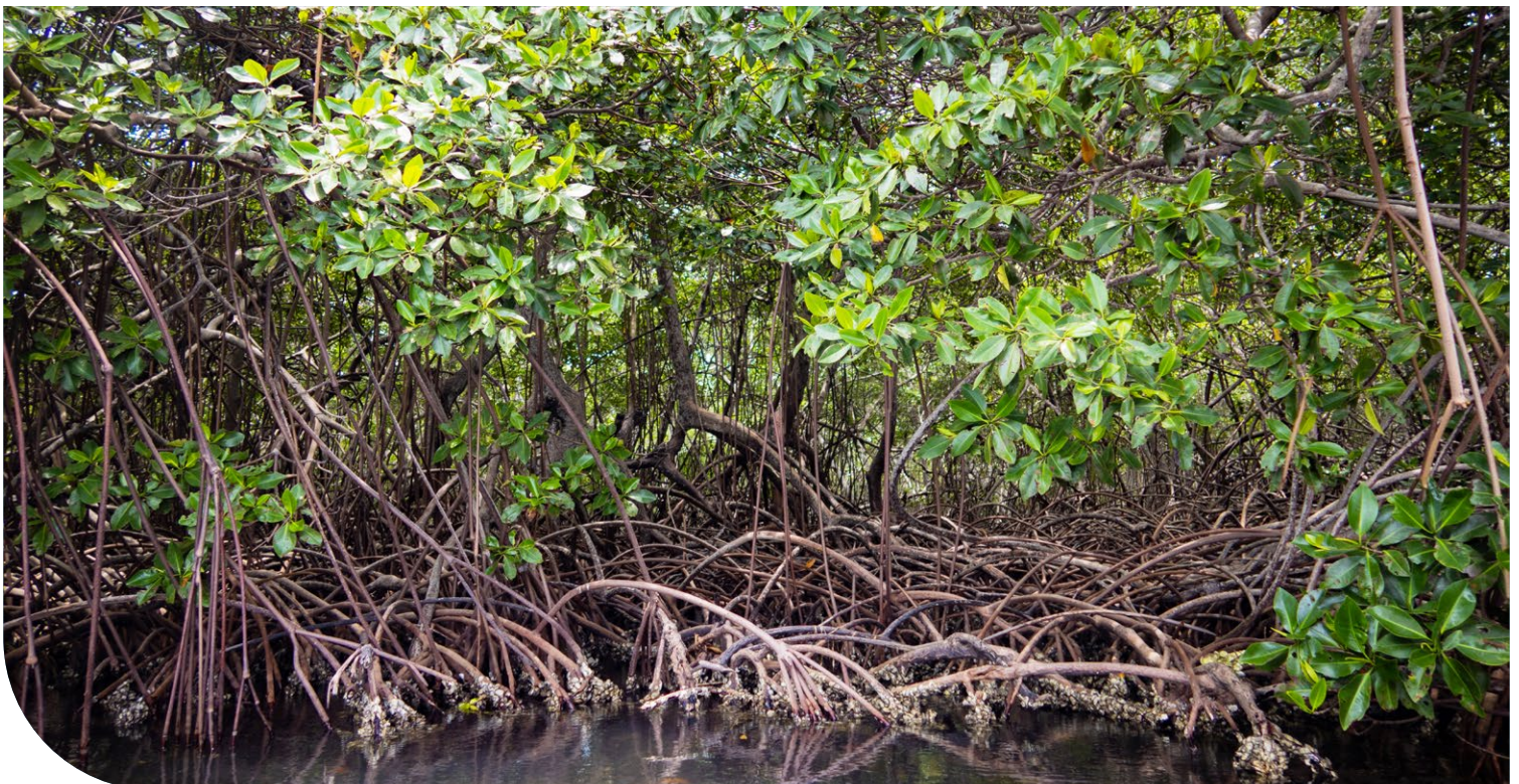
Mangroven-Wald ( Rhizophora ) an der Küste der kolumbianischen Halbinsel Barú.

Kohlendioxid-Rest-Emissionen werden zum Beispiel bei der Zement- und Stahlherstellung, im Luftverkehr und beim Schwerlasttransport, in der Landwirtschaft, aber auch bei der Müllverbrennung erwartet. Um sie auszugleichen, wird der Mensch Kohlendioxid im selben Umfang aus der Atmosphäre entnehmen müssen.