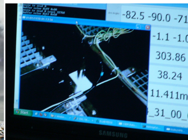
Abbildung 1: Test der neuen elektromagnetischen Quelle Sputnik vor Beginn des Transits nach Brasilien.

In dieser Woche wurden nur noch am 6. und 7. Februar aktive Experimente gefahren. Zum einen haben wir die Kartierung des Meeresbodens von Tristan da Cunha bis hin zum mittelatlantischen Rücken beendet. Ziel der Kartierung ist die Suche nach vulkanischen Strukturen, die ein Indiz einer möglichen sublithosphärischen Verbindung des Hotspots mit dem Rücken liefern könnte. Die Kartierung wurde entlang der ost-west-streichenden Tristan-Fracturezone, welche den Tristan da Cunha Komplex mit dem mittelatlantischen Rücken verbindet, ausgeführt. Während der Kartierung überquerten wir mehrmals die Tristan-Fracturezone, fanden jedoch keine direkten Anzeichen vulkanischer Strukturen. Unsere Kartierung endete wo die Fracturezone auf den mittelozeanischen Rücken trifft und wo sich ein ca. 5000 m tiefen Nodalbecken entwickelt hat. Direkt süd-westlich des Beckens kartieren wir einen 3 nm x 3 nm sogenannten core-complex, d.h. einen aus der unteren Kruste aufgeworfenen Gesteinskomplex aus Gabbro und Peridotit. Die bathymetrische Kartierung endete am 7.2. um 15:10.