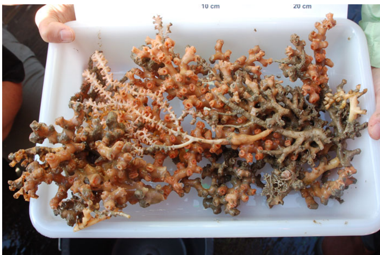
Reiche Ernte mit dem TV-Greifer: Eine lebende Solenosmilia Kolonie und eine lebende Bambus Koralle

CTD hatte die potentiell hoffige Tiefe schon etwas eingegrenzt. Überraschenderweise trafen wir dann aber bereits in ca. 1800m Tiefe auf Korallen. Hierbei handelt es sich um parautochtonen Schutt, der stellenweise lebende Äste zeigte. Die Steinkorallenkolonien gehören alle zur Gattung Solenosmilia . Weiter hangaufwärts, bereits im Einfluss des Mittelmeerausstromes, war die Korallenbesiedlung sehr rar, ganz vereinzelt wurden tote Lophelia Äste gesichtet. Generell waren die Canyonhänge durch geringe Sedimentbedeckung gekennzeichnet. Vielfach konnten wir zementierte, plattenartige Partien beobachten. Dem OFOS Einsatz sollte ein Landereinsatz folgen, der über einen längeren Zeitraum sowohl die Bodenströmung, als auch die Temperatur und den Salzgehalt des Bodenwassers registrieren sollte. Auffrischender Wind, zwischen 8 und 9 Bft. erlaubten aber eine Bergung des OFOS nicht mehr, so dass die ganze Nacht vom 2. auf den 3. 6. im Schichtwechsel der OFOS weiter geschleppt werden musste.