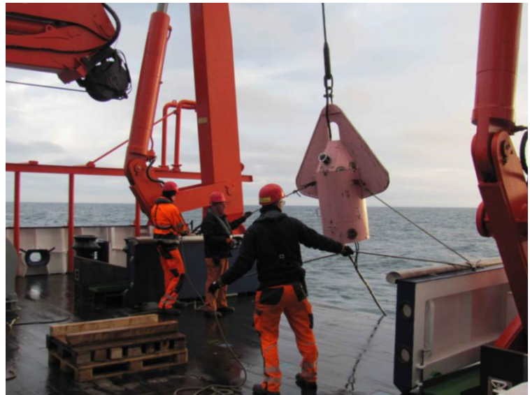
'Pig' beim Einholen

Am Samstag ließ uns die bislang ruhige See im Stich was weitere Außenbords-Messungen bei Windstärke 9 und bis zu 7 m hohen Wellen unmöglich machte. Wir verließen daraufhin das Kern-Arbeitsgebiet und schlossen noch einige Lücken in der bathymetrischen Kartierung mit dem Fächerecholot. Am Sonntag sind wir ins Kern-Arbeitsgebiet zurückgekehrt und bereiten HYDRA für den nächsten Einsatz vor, der hoffentlich am Montag nach Wetterbesserung erfolgt.