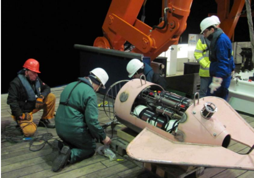
Vorbereitung Geräteträger 'Pig'

Receiver-Einheiten. Beim ersten Einsatz in der Nacht von Dienstag auf Mittwoch funktionierte der Signalgenerator erfreulicherweise, aber die Receiver-Einheiten zeichneten keine brauchbaren Daten auf. Daraufhin wurden einige Hardware-Änderungen an den Einheiten durchgeführt, und beim nächsten Einsatz am Freitag konnten Daten mit einem Receiver aufgenommen werden, beim zweiten war eine Platine