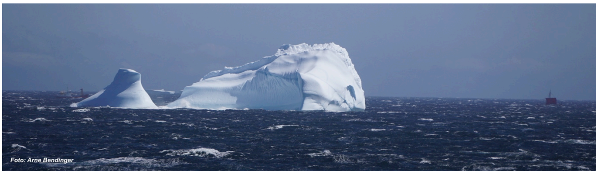
Die Draken Harald Hårfagre (rechts vom Eisberg) und die Viking Fjord (links vom Eisberg) vor der Südspitze Grönlands, aufgenommen von der Brücke der Maria S Merian

Nach dem nächtlichen Treffen mit der CCGS Hudson letzte Woche trafen wir diese Woche auf zwei weitere Schiffe: die Draken Harald Hårfagre , das größte Wikinger-Schiff das in der Neuzeit gebaut wurde, und ihr „Beiboot“ die Viking Fjord . Die Draken Harald Hårfagre ist, auf den Spuren Leif Eriksons, auf dem Weg von Norwegen nach Nordamerika und hat vor ein paar Tagen in Qaqortoq, nahe Kap Farvel, einen Zwischenstopp eingelegt, bevor die Reise über die Labrador See angetreten wurde. Wir trafen Sie bei Windstärke 8 bis 9 Bft von Eisbergen umgeben und gefolgt von der Viking Fjord (die deutlich mehr mit der See zu kämpfen hatte als das Wikinger Schiff).