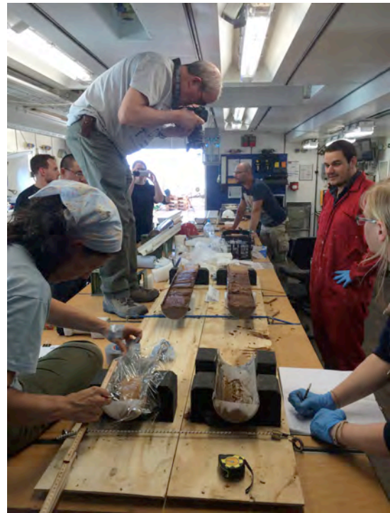
Die Arbeitsgruppen aus Lissabon und Southampton bei der Kernbearbeitung.

Die Untersuchungen zur Bestimmung der Oberflächengeochemie von Sedimentkernen in der Umgebung von Hydrothermalfeldern wurden mit 11 Schwerelotstationen weiter vorangetrieben. Einige dieser Kerne sind durch rote, hydrothermale Eisenoxidpartikel, die aus Plumewolken heraus durch die Wassersäule eingetragen werden, gekennzeichnet. Andere weisen sogar grobkörnige Sulfidlagen auf, die auf lokale Schüttungen zurückzuführen sind und somit die unmittelbare Nähe zu Sulfidhügeln anzeigen. Die Kerne werden an Bord geöffnet, beschrieben, fotografiert und für die Bordanalytik vorbereitet. Zur Bestimmung der Mineralogie und der chemischen Zusammensetzung werden durch die Arbeitsgruppe der Universität Lissabon eine