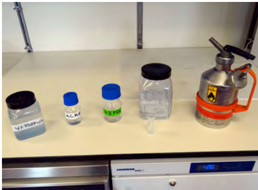
Übliche Fixierungslösungen für zoologische Exemplare umfassen (von links nach rechts) 4% Formalin, eine Mischung aus Aceton und Methanol (ACME), 4% Paraformaldehyd (PFA), RNALater, sowie unvergällter, 100%iger Alkohol (EtOH). (Alexander Ziegler)