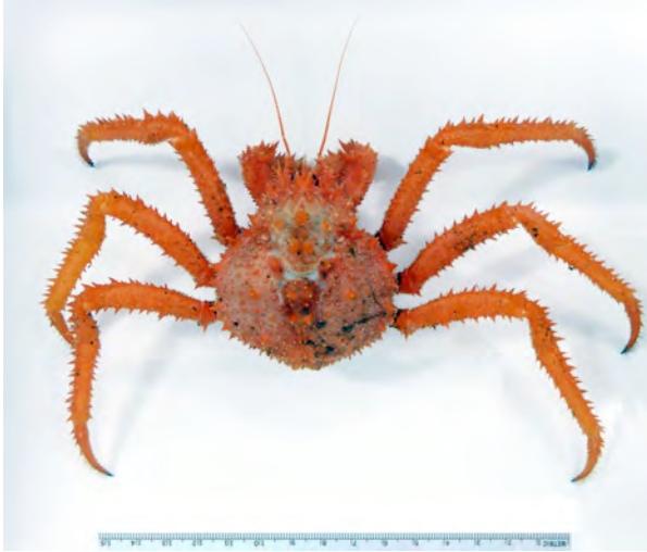
Diese Seespinne wurde in etwa 2.500 m Tiefe am Piip-Vulkan gefangen. Auf ihr saßen diverse Egel und Gespenstkrebse. (Alexander Ziegler)