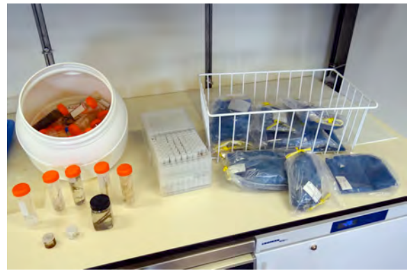
Alle im Verlauf der wissenschaftlichen Ausfahrt SO-249 gesammelten Exemplare wurden für die lange Rückreise vorbereitet, indem sie in Plastikgefäße oder wasserdichte Beutel verpackt wurden. (Alexander Ziegler)