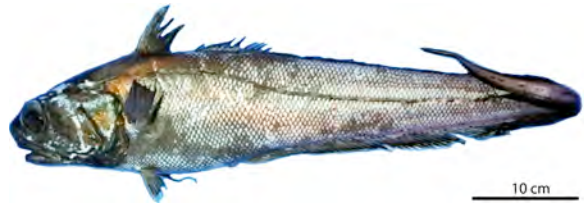
Ein Vertreter der Macrouridae (Grenadierfische) wurde in der Nähe des Komandorsky-Blocks aus etwa 2.600 m Tiefe an Deck befördert. (Natalia Gorbach)