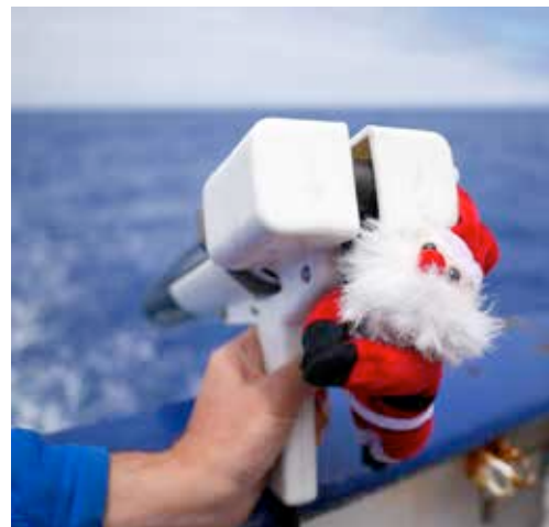
XBT Launcher am Heck der METEOR.

Südatlantiks genauer zu dokumentieren. Weiterhin interessiert uns der nordwärtige Transport des salzreichen Oberflächenwassers. Es ist davon auszugehen, dass diese Strömungen dazu beitragen, dass der Atlantik salzreicher als der Pazifik und der