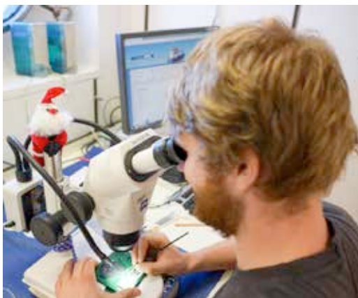
Die Foraminiferen werden einzeln herausgesucht und für spätere Analysen archiviert.

Jeden zweiten Tag halten wir an und nehmen mit dem Multinetz eine Station. Wir konnten einen sehr deutlichen Unterschied in der Anzahl der Foraminiferen in unterschiedlichen Wassermassen erkennen. Im Agulhas-Wirbel am Anfang der Reise fanden wir 5-10 mal so viele Organismen im Vergleich zum zentralen Südatlantik.