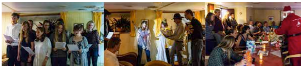
Weihnachtsfeier in der Messe der METEOR

wurden aufgestellt und kunstvoll geschmückt. Die Speisekarte wurde besonders festlich dekoriert und die Küche roch besonders lecker nach frischen Weihnachtsplätzchen und vielen traditionellen Weihnachtsgerichten. Der METEOR Chor traf sich zum Proben, ein Theaterstück wurde über viele Nachtschichten hinweg von Elisabeth Thölken geschrieben und von einer 13 köpfigen Schauspielergruppe mehrfach geprobt und verfeinert. Kostüme wurden dafür gesucht und gebastelt, kleine Briefchen für die Weihnachtspostkästen (leere XBT Hüllen) geschrieben, kleine Geschenke eingepackt und Gedichte und Geschichten für die Weihnachtsfeier gefunden. Am Heiligen Abend war es dann soweit, und nach dem Festessen fand eine sehr gelungene Feier in Deutsch – Englisch – Französisch – Spanisch statt.