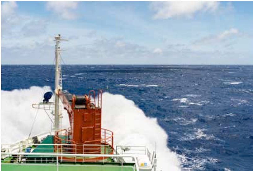
METEOR mit steifer Briesse gegenan

Gefreut haben wir uns über viele Grüße: Die Forschungsministerin Prof. Dr. Wanka schickte uns einen Weihnachtsbrief, Kollegen von anderen Schiffen und an Land ließen Grüße ausrichten. Wir hatten schon Anfang der Woche Radiogrüße für die NDR Sendung „Weihnachtsgrüße an Board“ aufgezeichnet.