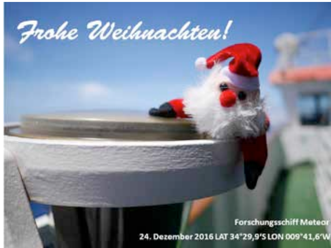
Auch auf dem Südatlantik wird Weihnachten bemerkt

Weihnachten auf See. Für viele von uns war es ein ganz besonderes Erlebnis, das Weihnachtsfest fern ab von Freunden und Familien, im Kreise der METEOR Familie zu feiern. In allen Bereichen wurden in der Freizeit Sonderschichten geschoben. Die Messe wurde mit Tischdecken weihnachtlich geschmückt. Zwei Bäume