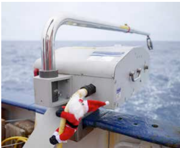
Winde der U-CTD am Heck der METEOR.

Alle Stunde wird eine 400 m tiefes Temperatur- und Salzgehaltsprofil mit der Unterwegs-CTD Sonde genommen und alle zwei Stunden durch ein 800m tiefes XBT Profil ergänzt. Die Daten erlauben es uns, die Erwärmung der oberen Schichten des