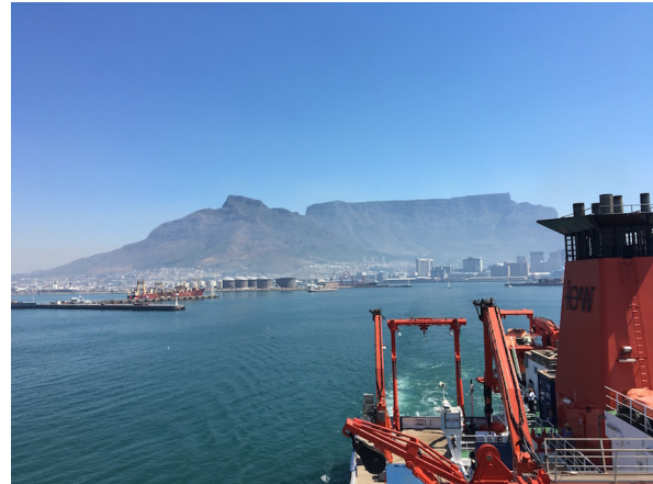
Auslaufen der Merian in Kapstadt mit Sicht auf den Tafelberg

Am Mittwoch den 04. Januar 2017 starteten wir am frühen Nachmittag unsere Reise von der südafrikanischen zur brasilianischen Küste, entlang 34^{\circ}30'S . Der Großteil der Ausrüstung war am 02. Januar morgens von der Agentur vor Ort angeliefert worden und umgehend wurde mit dem Aufbau der Gerätschaften begonnen. Die Kohlenstoff Gruppe aus Exeter richtete ihren eigens mitgebrachten Messcontainer ein, die GEOMAR Spurengas-Gruppe installierte ein Gewirr an Metallröhrchen und