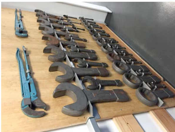
Hätten Sie nicht auch gerne diesen Schraubenschlüsselsatz zu Hause in Ihrer Werkstatt? (Kaj Hoernle)