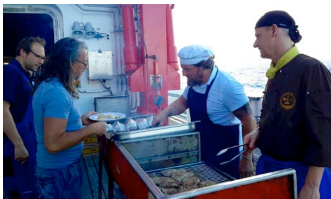
Grillen am Deck beim Bergfest. (Nina Hinz)