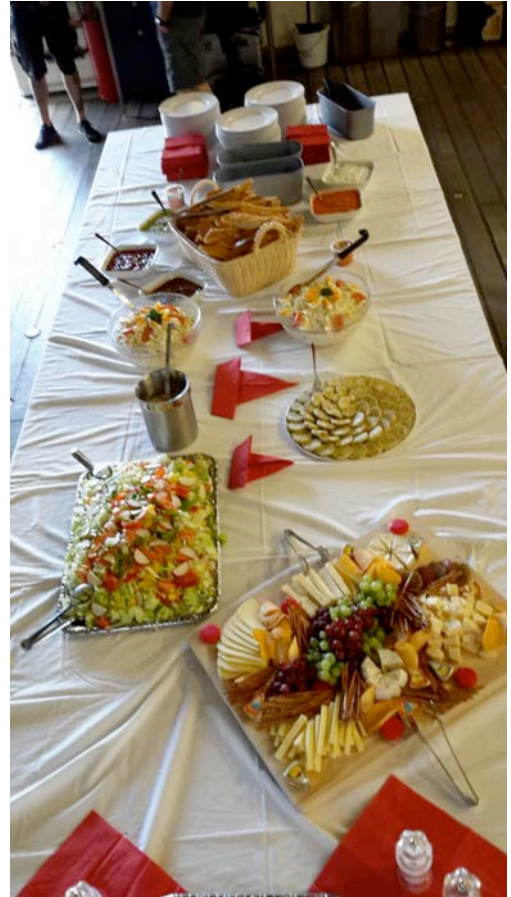
Eine Menge Beilagen zum gegrillten Steak, Schwein, Lamm, Würsten und Lachs. (Nina Hinz)