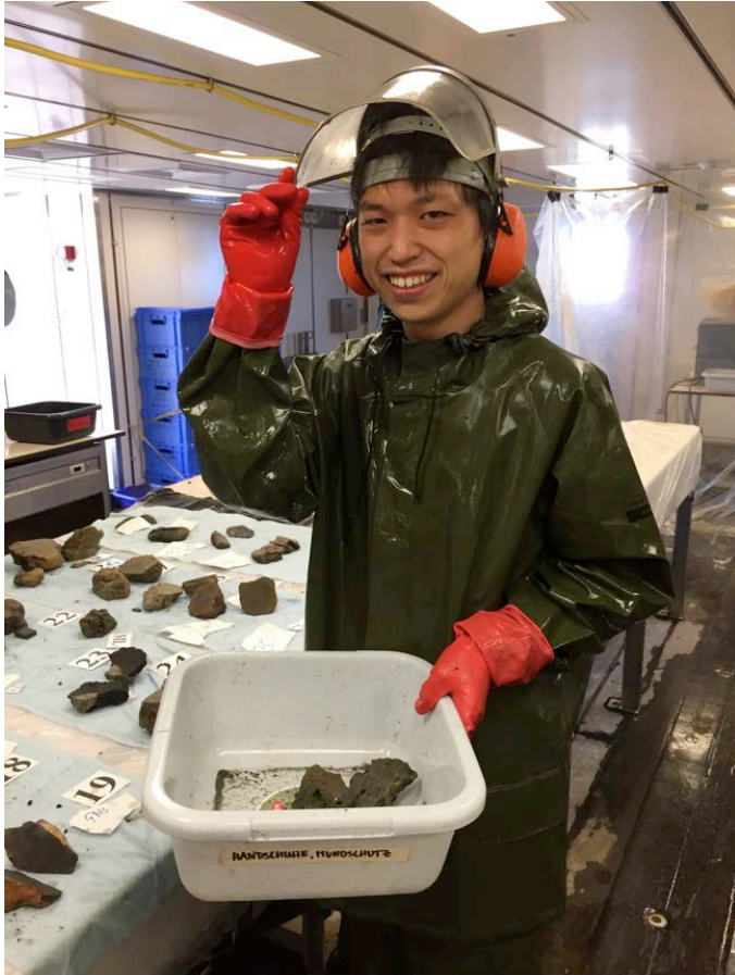
Das Sägen der Gesteine ist ein schmutziges Geschäft. (Kaj Hoernle)