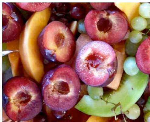
Leckere Obst Platte beim Bergfest. (Nina Hinz)