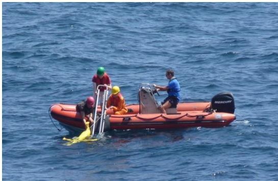
Auslegung eines Gleiters auf dem 12°S Schnitt

Die zweite Woche verlief sehr erfolgreich. Wir konnten die Prozessstudie zu Fronten und Filamenten im südlichen Arbeitsgebiet bei 14°S am Montag abschließen und eine dort in der letzten Woche ausgesetzte treibende Sedimentfalle wieder aufnehmen. Auf dem Weg zu unserem Hauptschnitt auf 12°S haben wir zwei Gleiter aufgenommen, die bereits auf der vorangegangenen METEOR Reise M135 ausgesetzt wurden. Durch ihre Echtzeitdatenübertragung haben sie uns beim