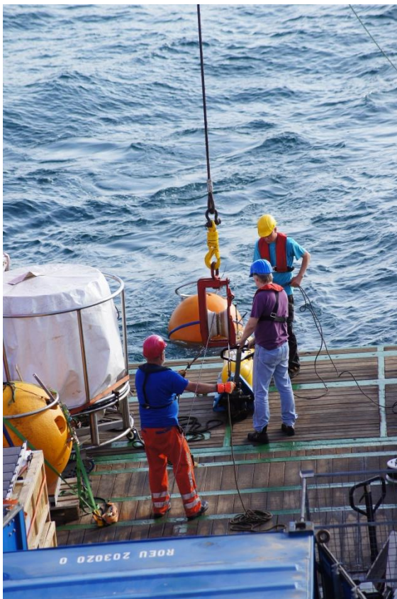
Aussetzen einer Verankerung mit einer am Draht profilierenden CTD und eines Strömungsmessers (Moored Profiler).

Während der Aussetzphasen der BIGOS werden an den gleichen Positionen mikrobakterielle Stoffumsatzraten in verschiedenen Tiefen der Wassersäule bestimmt. Bei den vom Max-Planck Institut für Marine Mikrobiologie durchgeführten Messungen werden die Raten durch unterschiedliche Inkubationen mit ^{15}\text{N} , ^{13}\text{C} und ^{18}\text{O} markierten Verbindungen quantifiziert und genetische Untersuchungen für die Identifizierung und Quantifizierung von Bakterienstämmen durchgeführt.