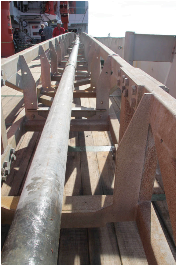
Abb. 2 15 m Schwerelot im Kernabsatzgestell

beprobte und auf die Geochemie von Porenwasser untersucht. Dabei gilt das Forschungsinteresse vor allem der Untersuchung sogenannter "Seeps". Hierbei handelt es sich um Austrittsstellen von Fluiden die durch bestimmte Prozesse aus den tieferen Sedimentschichten an die Meeresoberfläche gelangen. Während der