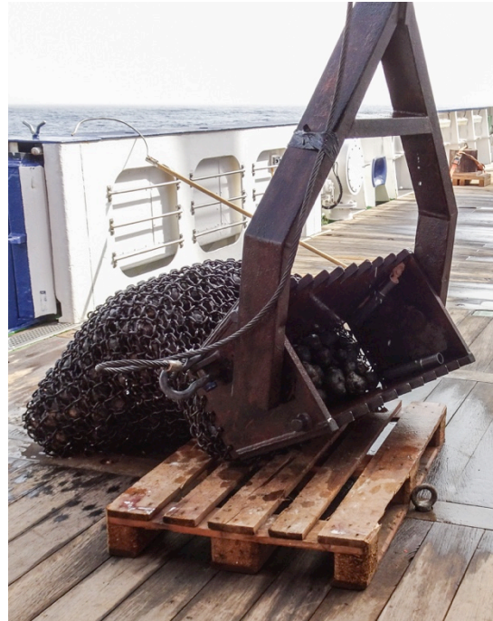
Ein überraschender „Fang“ aus der Guinea Fracture Zone: eine Dredge voll mit Manganknollen.

Wir sind mit dem stetigen Wechsel von Kartier- und Dredgephasen inzwischen ein gut eingespieltes Team. Die Zusammenarbeit der wissenschaftlichen Gruppen und der Mannschaft funktioniert hervorragend und zusammen kommen wir sehr gut voran.