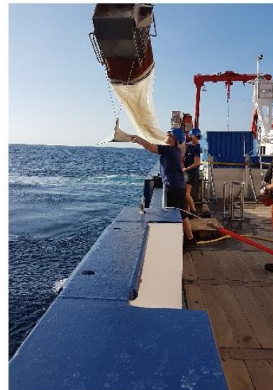
Abb. 1: Verschiedene Planktonnetze der Universität Hamburg im Einsatz: Isaacs-Kidd Midwater Trawl (IKMT, oben links), 1-Quadratmeter-Doppel-MOCNESS (oben rechts), Apstein-Netz (unten links), geschlepptes Multinetz (unten rechts)