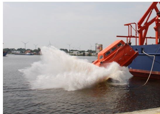
Test des Freifall-Rettungsboots

Nach dem Ablegen, das landseitig von der Meteor Crew unterstützt wurde, ging es durch die Schleuse Richtung Nordsee. Auch dieser Fahrtabschnitt war einprägsam: da einige der Crew Mitglieder in der Gegend von Emden wohnen, wurde die Gelegenheit genutzt einen Sonntagsausflug zur Schleuse zu unternehmen und Papi auf Wiedersehen zu sagen.