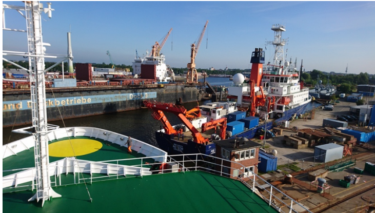
Blick über das Vordeck der Merian auf die Meteor und den Hafen von Emden

Die Reise MSM94 mit FS Maria S. Merian startete am Sonntag den 2. August 2020 in Emden/Ostfriesland. Nach 4 Tagen in der Quarantäne, die glücklicherweise für alle mit einem negativen COVID-19-Test ausging, wurden wir von Leer nach Emden