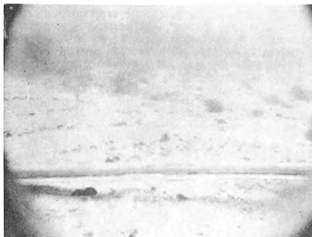
Fig. 6. Ostsee, Kieler Bucht, 300 m querab Leuchtturm Bülk auf dem Kell- berg, Tiefe 5 m, Kunstlicht.