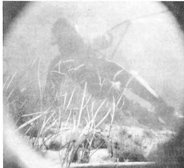
Fig. 5. Ostsee, Kieler Bucht, nordwestl. von Laboe, Tiefe 4 m, Tageslicht.