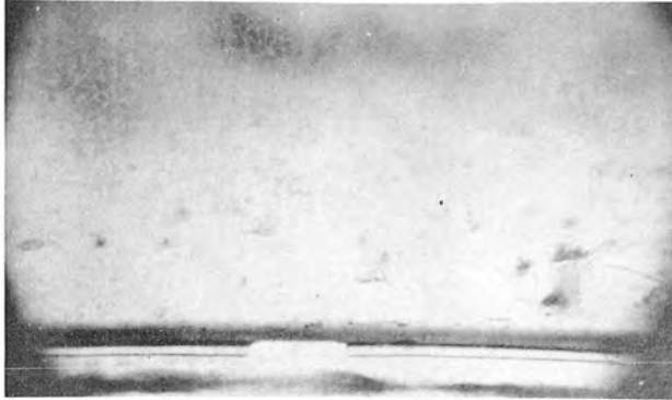
Fig. 4. Ostsee, Kieler Bucht, nordwestl. von Laboe, Tiefe 3 m, Tageslicht.