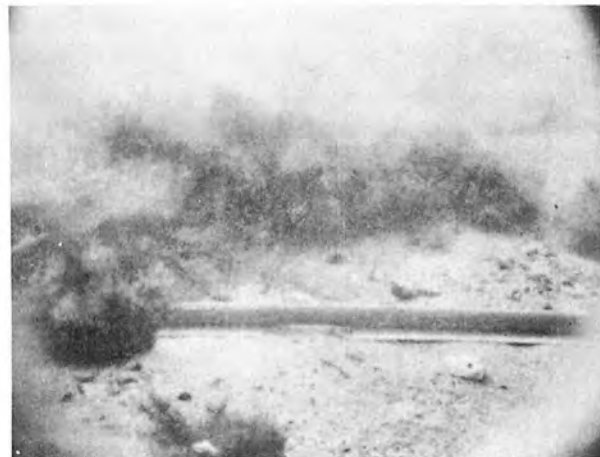
Fig. 3. Ostsee, Kieler Bucht, 1000 m südöstl. von Tonne Markelsdorf, Tiefe 11 m, Tageslicht.