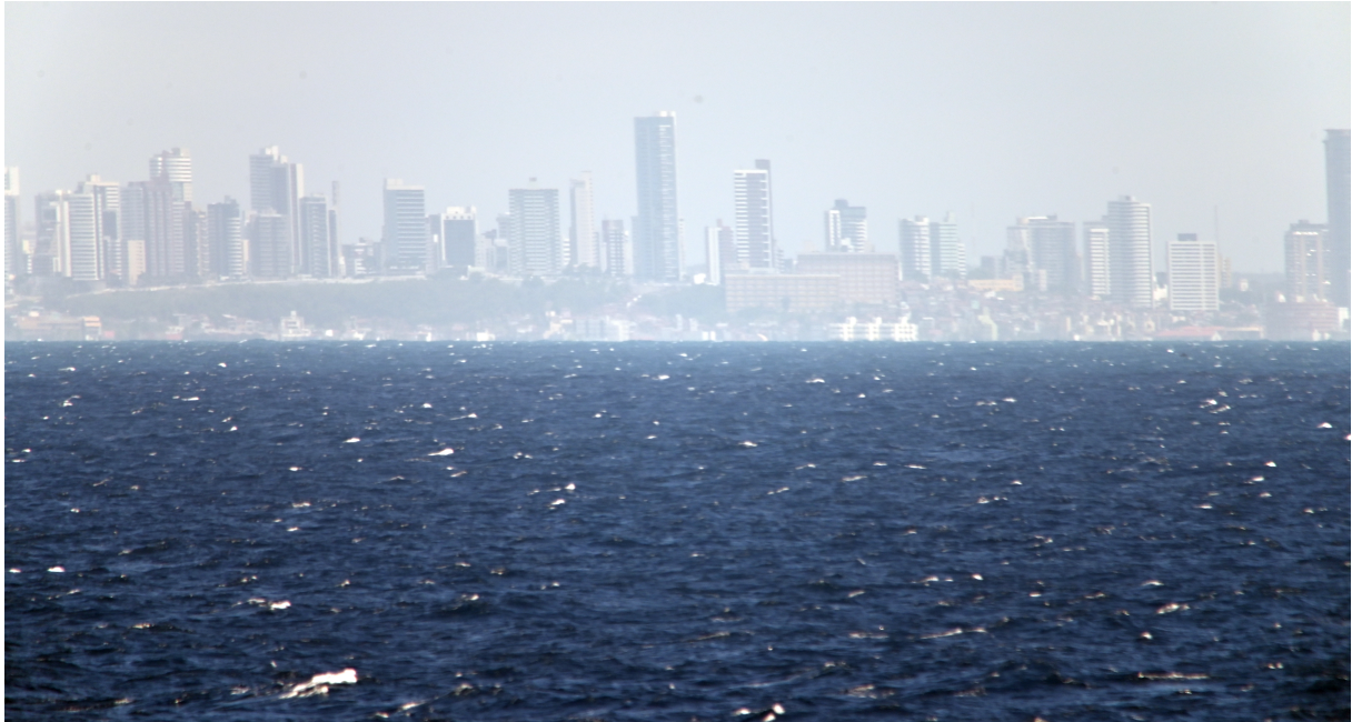
Abb. 3: Die Stadt Natal in einer Entfernung von etwas 12 nm vom FS Sonne fotografiert.

Mittlerweile haben wir auch den 5°S Schnitt über den westlichen Randstrom abgeschlossen. Dieser Schnitt endete etwa 12 nm vor der brasilianischen Stadt Natal, die man am Horizont schon ganz gut erahnen konnte.